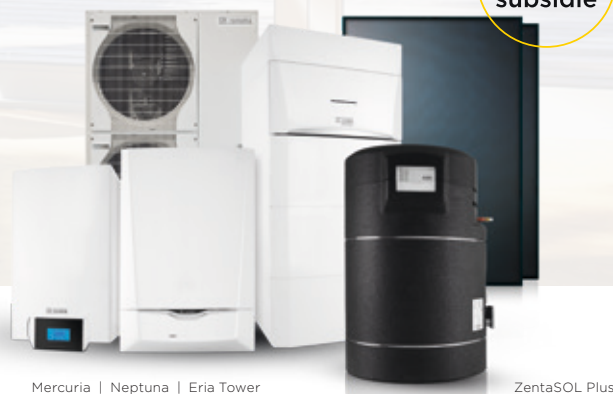
Mercuria | Neptuna | Eria Tower